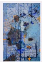
AREBENOR BASSENE – NDAR GUEDJ , 2023 – ACRYLIQUE, PIGMENTS NATURELS, ENCRE ET GRAPHITE SUR TOILE, 160 X 340 CM, © TOUS DROITS RESERVES

Originaire du Mali, Amadou Sanogo puise dans la tradition populaire pour produire une peinture vive et narrative. Formé à l'Institut National des Arts de Bamako, il compose un langage visuel empreint d'humour et de critique sociale.