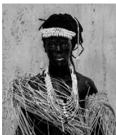
ZANELE MUHOLI – ZIPHI II EMHLABENI, 2019 – TIRAGE SUR PAPIER HAHNEMUHLE PHOTORAG BARYTÉ. EDITION 3/8. 60 X 52 CM