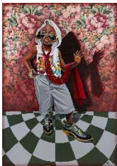
JP MIKA – LE PRÉTENDANT SAPEUR , 2015 – ACRYLIQUE SUR TISSU 168 X 118 CM, © JP MIKA, ADAGP, 2025/2025, PROLITTERIS, ZURICH

L'artiste mozambicain Estevão Mucavele mêle influences africaines et contemporaines dans des paysages inspirés de ses voyages. Son œuvre, exposée internationalement, célèbre l'union entre nature, mémoire et identité.