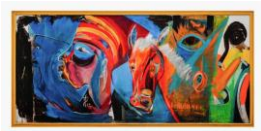
EL HADJI SY – LAT DIOR , 2023 – PEINTURE ACRYLIQUE ET PAPIER SUR TOILE, 160 X 340 CM, © TOUS DROITS RESERVES

Toute reproduction devra obligatoirement être accompagnée des mentions spécifiques indiquées ci-dessous. Nous mettons également à votre disposition d'autres visuels d'œuvres, qui peuvent vous être transmis sur simple demande écrite adressée à communication@cbhbank.com .