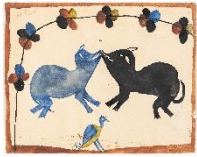
ALBERT LUBAKI – SANS TITRE , CA. 1929 – AQUARELLE SUR PAPIER, 52 X 66 CM, © TOUS DROITS RESERVES

Albert Lubaki fut l'un des précurseurs de la peinture moderne congolaise. Il a développé un style original mêlant abstraction et narration. Son œuvre sur papier fut reconnue dès 1929 et reste célébrée aujourd'hui.