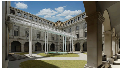
Plasmah 1 – La Passerelle (2024) Vincent Lamouroux (1974)

Bois H 8,7 x L env. 28 m