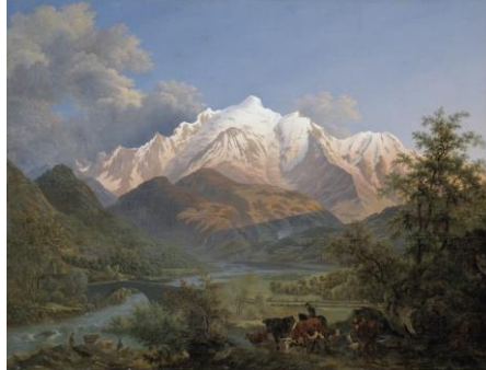
Pierre-Louis De la Rive (Genève, 1753 — Presinge, 1817) Le Mont Blanc vu de Sallanches au coucher du soleil, 1802

Huile sur toile ; 129 x 169 cm ; Achat, 1969