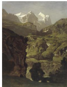
Barthélemy Menn (1815 - 1893) Le Wetterhorn vu depuis le Hasliberg, entre 1843 et 1845